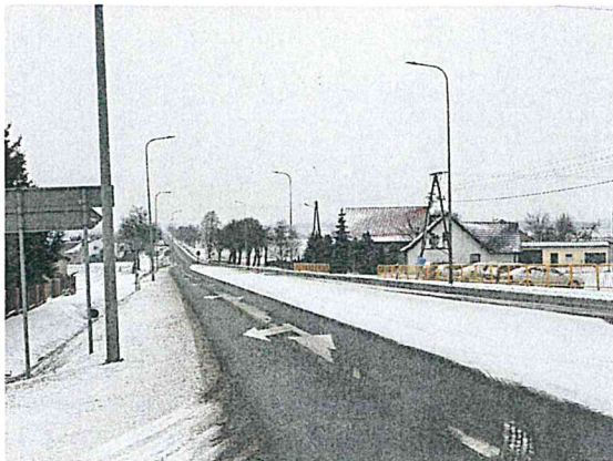
Droga wojewódzka nr 470