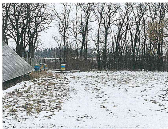
Działka z przeznaczeniem pod budowę altany