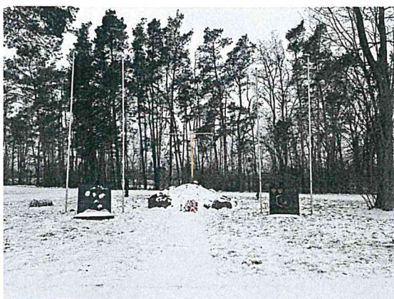
Pomnik powstańców styczniowych