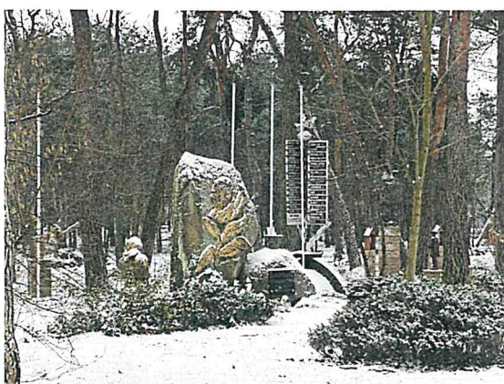
Droga krzyżowa i pomnik pamięci