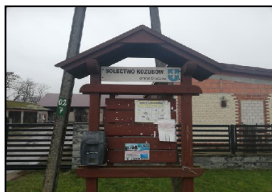
Sołecka tablica ogłoszeń