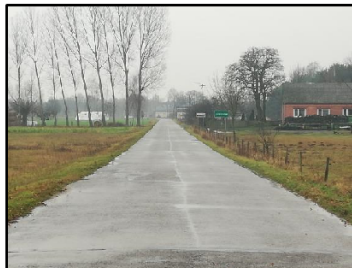
Droga powiatowa w solectwie