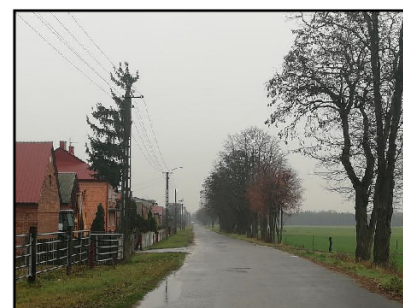
Główna droga w sołectwie