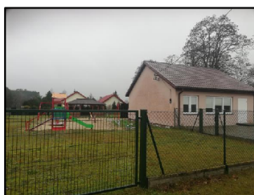
Ogrodzony plac przy świetlicy