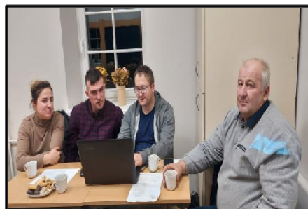
Warsztaty z budowania Sołeckiej Strategii Rozwoju Wsi 26.11.2024 r. i 3.12.2024 r., GOK Wozownia Kolnica