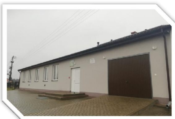
Budynek Świetlicy wiejskiej