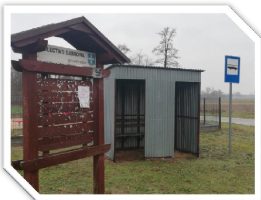
Sołecka tablica ogłoszeń