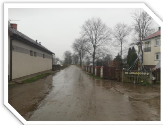
Infrastruktura drogowa w sołectwie